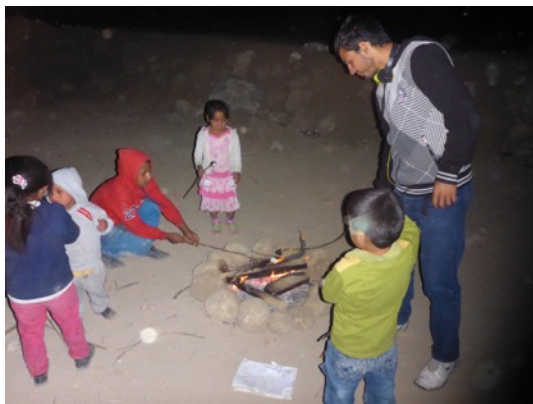
Haciendo “S’mores”, un postre americano de malvaviscos, chocolate, y galletas dulces hecho por una fogata.