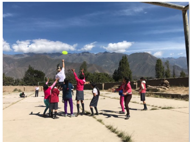
Enseñando Frisbee, un deporte americano