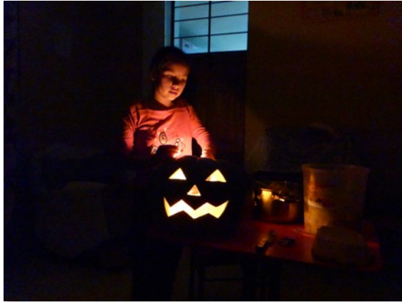
Haciendo un “Jack-O-Lantern” de zapallo para Halloween