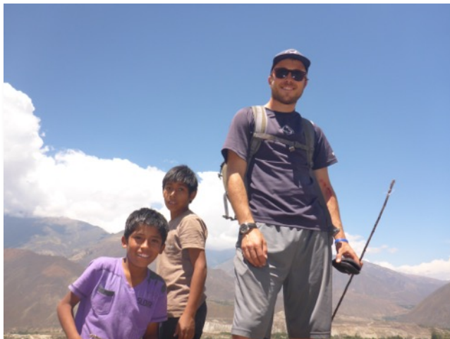
Enseñando a mis estudiantes cómo atrapar lagartijas