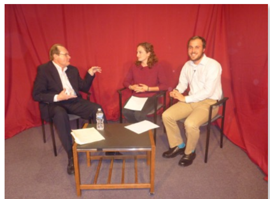
Hablando sobre Perú y Caraz en un programa de televisión americana.

El Voluntariopis Carazchaw atska quechuata yachakurqun, tsaymi pay Carazpiq kushi kushi aywaykan.