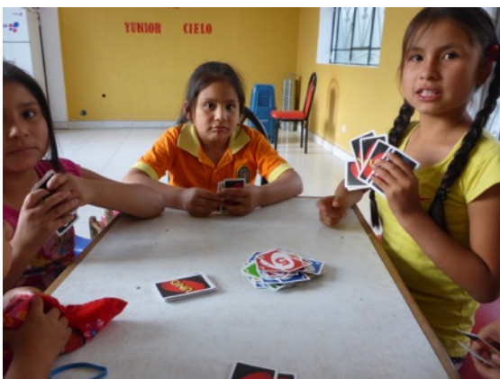
Jugando “Uno”, un juego americano de cartas