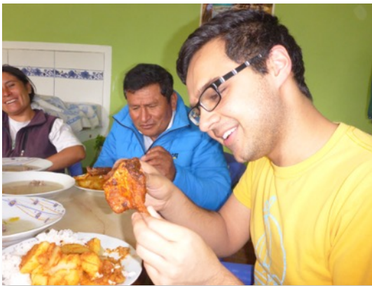
Haciendo probar cuy a mis amigos