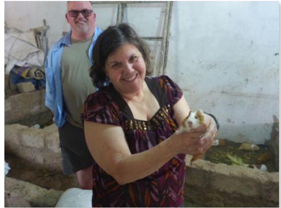
Enseñando a mis papás los cuyes