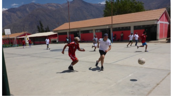
Jugando fulbito con mi gerencia