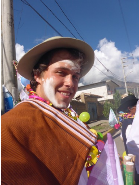
Desfilando en el Carnaval Huaylino

Metas 2 y 3 de Cuerpo de Paz tienen que ver con el intercambio cultural. Durante los dos años del trabajo, el Voluntario ha tomado muchas oportunidades para aprender más de la cultura Peruana y para compartir su cultura y realidad de los Estados Unidos.