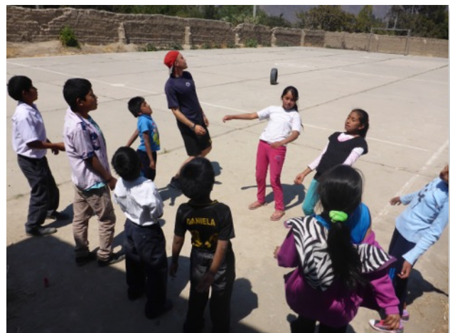
Enseñando el “Wobble”, un baile americano de Hip Hop